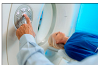
Scanner à R. Magnétique