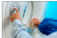
Escáner R. Magnética