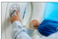
Scanner Magnetici R.