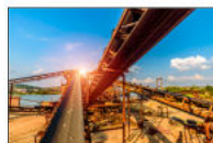
Riciclaggio e estrazione mineraria