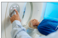
Scanner Magnetici R.