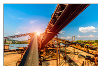
Riciclaggio e estrazione mineraria