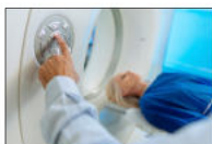
Scanner Magnetici R.